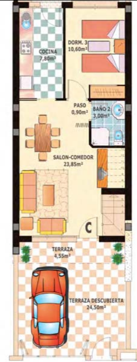
Planta Baja Vial